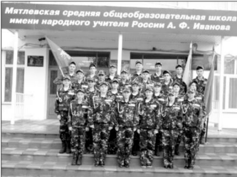
Мятлевская средняя общеобразовательная школа имени народного учителя России А. Ф. Иванова

Традиционно участие наших школьников в областном конкурсе паспортов краеведческих объектов, где каждый год среди ребят есть призеры, и в уже полюбившемся районном конкурсе «Моя земля - земля особая».