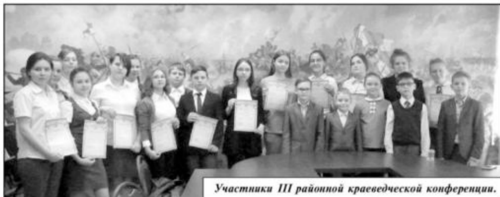
Участники III районной краеведческой конференции.

Кто больше всего знает об истории, традициях, загадках, легендах, происхождении того или иного в регионе, городе, поселении или маленькой деревне? Конечно же, те, кто этим всерьез интересуется. Историки, археологи и палеонтологи, архивисты, этнографы и филологи, искусствоведы и писатели - словом, исследователи. Каждая из вышеперечисленных наук и многие другие в той или иной степени соприкасаются с большой кропотливой работой, благодаря которой мы с вами узнаем больше о своей родине, национальной культуре, искусстве, становимся духовно богаче и сильнее.