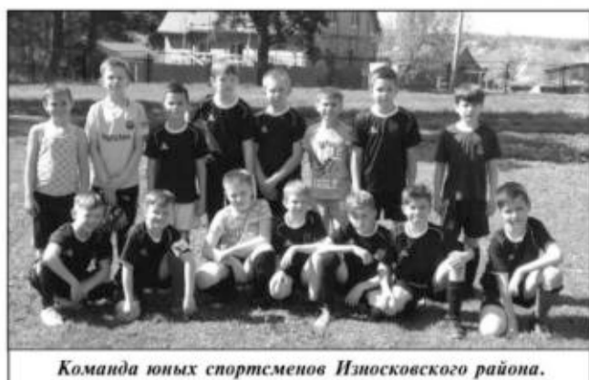
Команда юных спортсменов Износковского района.