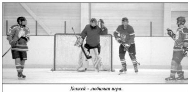
Хоккей - любимая игра.