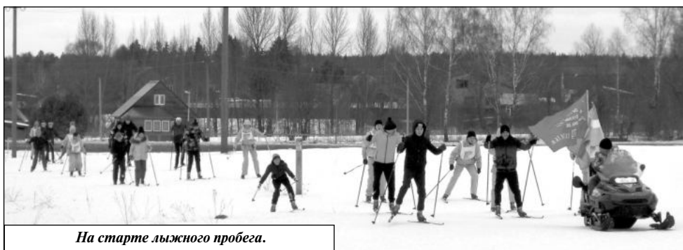
На старте лыжного пробега.

Продолжением памятного мероприятия стал традиционный лыжный пробег по маршруту: мемориал «Ивановское поле» – урочище Пинашино – братское захоронение в деревне Захарово. Впервые такой пробег состоялся в 2018 году. Тогда, как и сейчас, он был организован в память о событиях, происшедших на рубеже реки Воря в 1942 – 1943 годах.