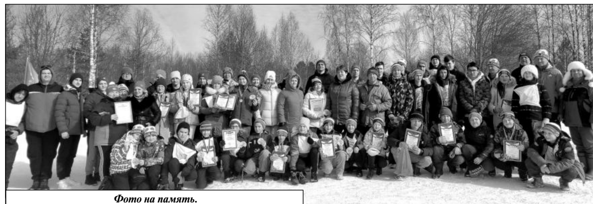
Фото на память.

Возродилась деревня Клины в 2010 году. Тогда был найден и благоустроен протекающий в тех местах святой источник, известный с давних времен. Его освятили в честь Владимирской иконы Божьей матери. Рядом построили купель. Позже был установлен поклонный крест. В 2013 году во время Вахты Памяти из земли были подняты останки 40 бойцов и найдены три медальона, из которых один раскрылся. Он принадлежал Сергею Федоровичу Вино-