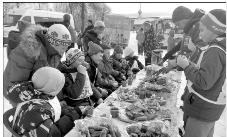
После лыжного забега взрослых и детей ждал настоящий полевой обед с вкусной солдатской гречневой кашей, а также чай, различные сладости и угощения.