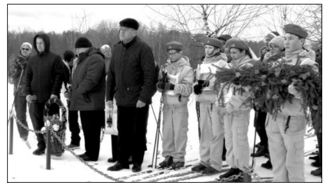
Мемориальный комплекс «Ивановское поле». Возложение.

Тема памяти звучала и в выступлении заместителя главы администрации МР Износковский район