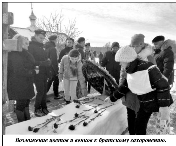
Возложение цветов и венков к братскому захоронению.