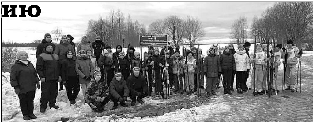
Направление – ПАМЯТЬ... Торжественное открытие дорожного указателя.